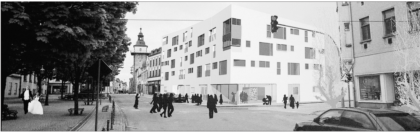
Der Entwurf für einen neuen Markt, wie er vom Planungsbüro vorgestellt wurde. An der Fassade soll noch nachgebessert werden.

Noch einmal zur Erinnerung: Schon seit Jahren ringt die Stadt um eine Lösung am Markt. Der Abriss des alten Kaufhauses erfolgte in der Hoffnung auf einen dänischen Investor, der dort einen Einkaufsmarkt und ebenfalls Wohnungen plante. Diese Hoffnung zerschlug sich, der Investor trat vom Vorhaben zurück, das Grundstück fiel zurück an die Stadt, landete von dort aus beim Sanierungsträger BauBeCon. Dann wurde das Grundstück von der städtischen Wohnungsbaugesellschaft SWB gekauft. Es gibt unterschiedliche Darstellungen, ob die Ini-